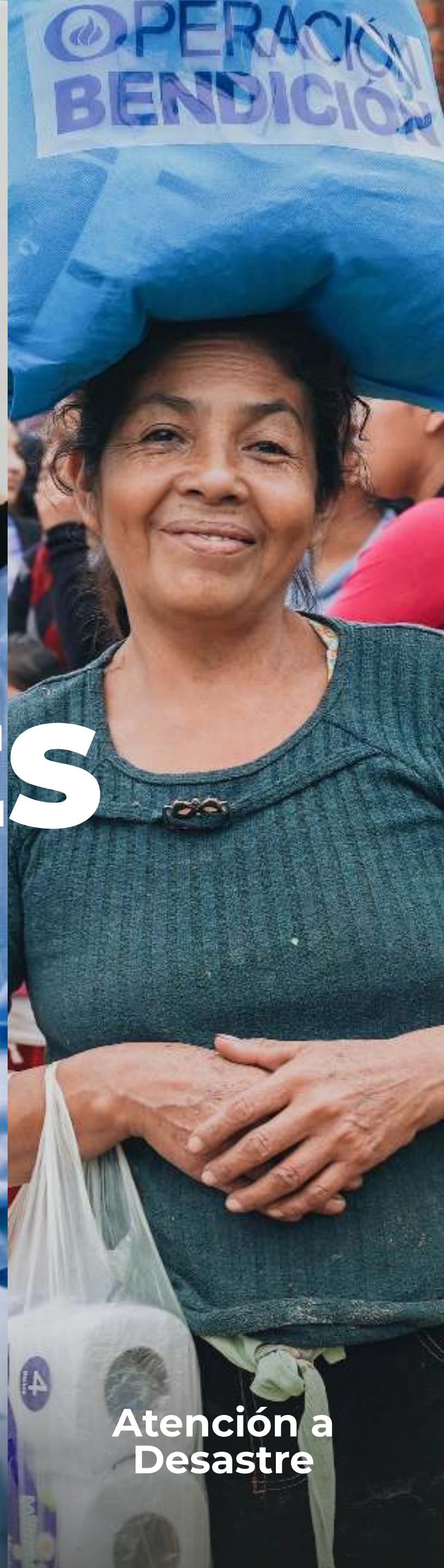
Atención a Desastre