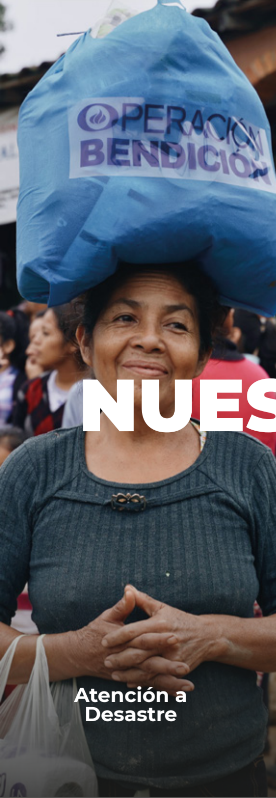
Atención a Desastre